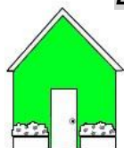
Mornant Du 7/07 au 30/07